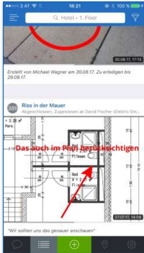
Foto- und Plananmerkungen ohne Papier