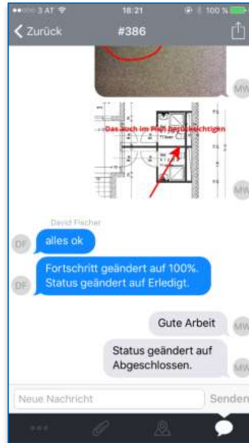
Durchgängige Kommunikation Aller Projektbeteiligten