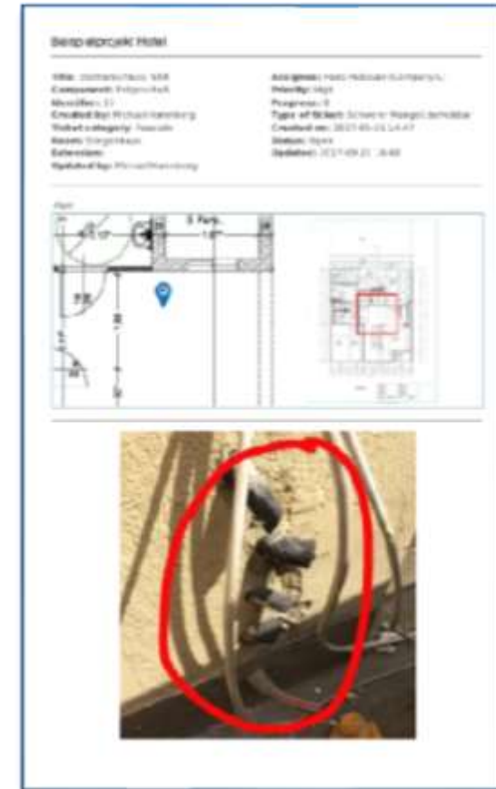
Individuelle Berichte auf Knopfdruck